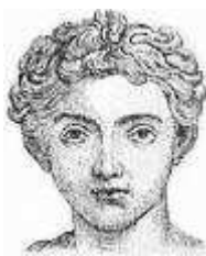
Caius Valerius Catullus