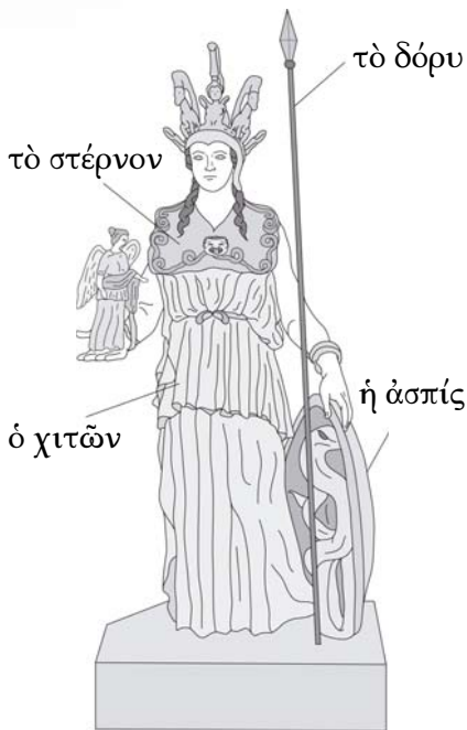
τὸ ἄγαλμα τῆς Ἀθηνᾶς