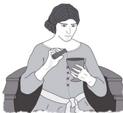
ἡ Μήδεια ἐγγεῖ τὸ φάρμακον εἰς τὸ ποτήριον