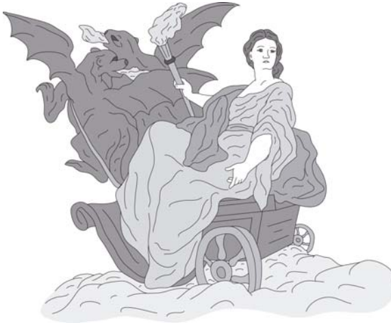
ἡ Μήδεια φεύγει ἐπὶ ἀμάξης διὰ τὸν οὐρανόν

Ὁ οὖν Θησεὺς οὐκ ἀποθνήσκει. Ὁ δὲ Αἰγεὺς ἐθέλει τὴν Μήδειαν ἀποκτείνειν, αὕτη δὲ φεύγει ἐπὶ ἀμάξης διὰ τὸν οὐρανόν· φαρμακίς 80 γὰρ ἐστίν. Ὁ δὲ Θησεὺς καὶ ὁ Αἰγεὺς Ἀθήνησιν οἰκοῦσιν.