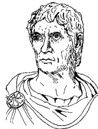
L. Cornēlius Sulla.

Hunc post dominātiōnem L. Sullae libīdō māxima invāserat rei pūblicae capiundae, neque id quibus modīs ad-