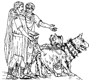
Catilīna adulēscentī canēs mercātur.