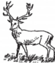
cervus -ī m