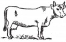
vacca -ae f