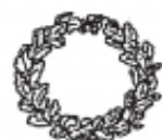
corōna -ae f

Vīlicae quae sunt officia, cūrātō faciat! Sī eam tibi 143 dederit dominus uxōrem, eā estō contentus! Ea tē metuat facitō! Nē nimium luxuriōsa siet!... Ad cēnam nē quō eat, nēve ambulātrix siet... Munda siet. Focum pūrum circum- 2 versum cotīdiē, priusquam cubitum eat, habeat. Kalendīs, īdibus, nōnīs, fēstus diēs cum erit, corōnam in focum in- dat, per eōsdemque diēs Larī familiārī prō cōpiā supplicet. Cibum tibi et familiae cūret utī coctum habeat.