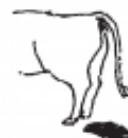
stercus -oris n