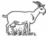
capra -ae f